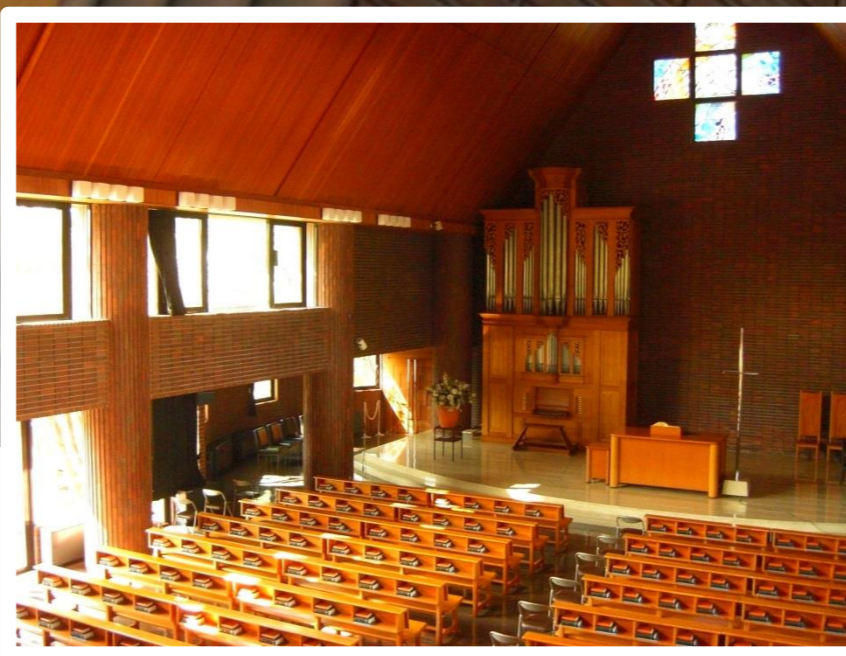
瀬戸キャンパスチャペル内

本学の教職員や学生が中心となって行われる礼拝です。聖書のお話から個人的な趣味の話まで、更にはバンド演奏など、様々な奨励や活動発表を楽しむことができます。